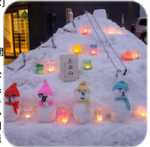
(まちづくりセンター前)

1月に入り、例年に無い暖冬が続いたことから、主催者及び関係者は“キャンドル制作が思うように進まず、イベント開催が可能かどうか？”と憂慮しましたが、期間中は、雪も降らず、また風も穏やかで無事に終了することが出来ました。