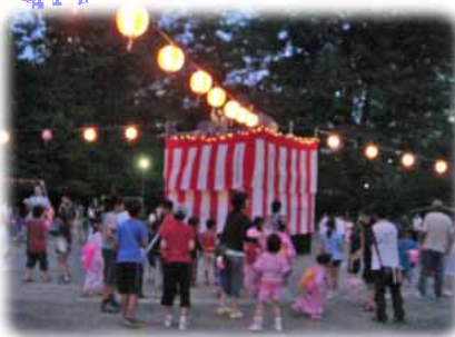
(一区町内会連合会)

毎年恒例の納涼盆踊り大会が二区と三区が8月8日(土)、一区が9日(日)に開催されました。