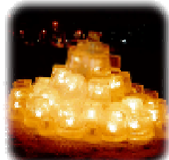
尚志学園高校 イベント予定地