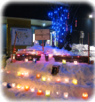
中の島まちづくりセンター