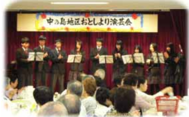
尚志学園高等学校吹奏楽部