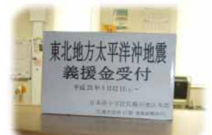
まちづくりセンター事務所前

また、中の島まちづくりセンター(821-5841)でも義援金の受付を行っています。