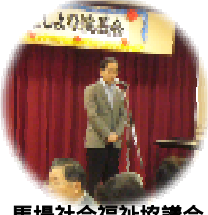
馬場社会福祉協議会 事務局長