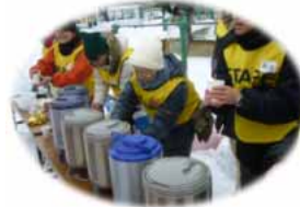
暖かいココアの差し入れ