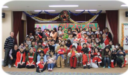
12月15日 あいあいクリスマス