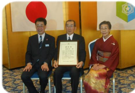
11月21日 自治振興功労者表彰