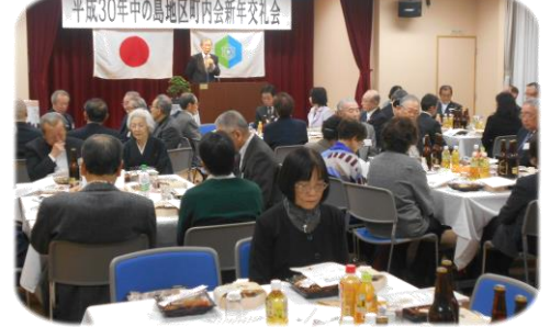
1月7日 中の島新年交礼会