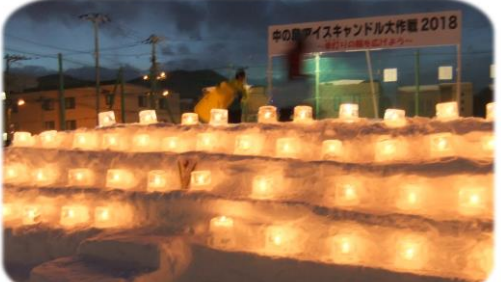
1月29～31日 アイスキャンドル大作戦