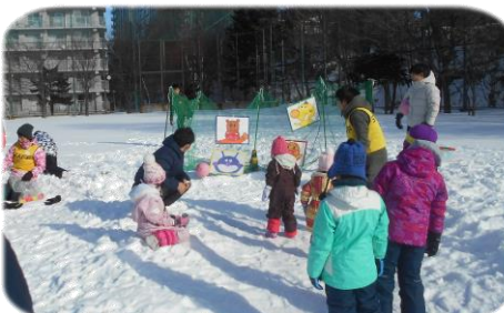
1月11日 元気ゆきんこまつり