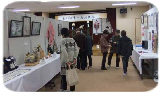
11月3・4日 中の島文化祭