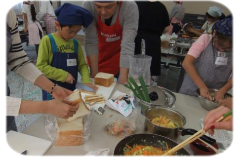
10月14日 親子クッキング