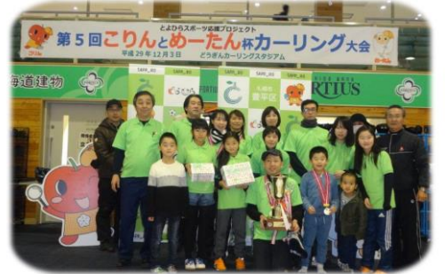
12月3日 カーリング大会