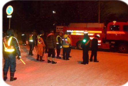
12月19日 歳末防火パトロール