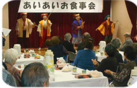
10月10日～12日 あいあいお食事会