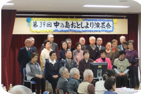
11月12日 お年寄り演芸会